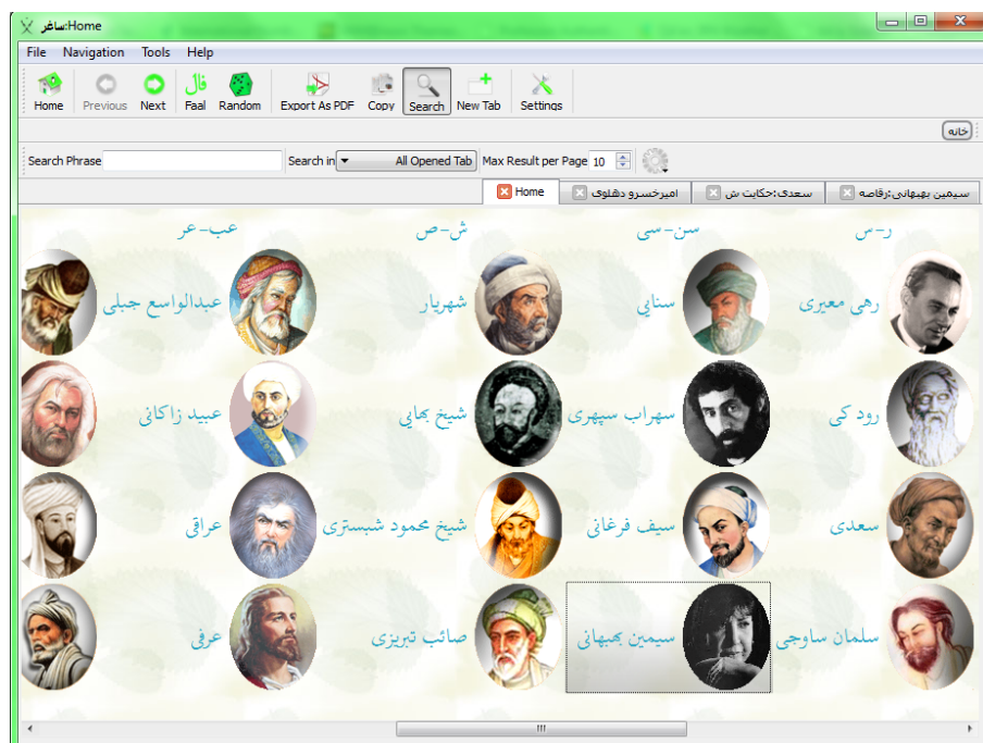
شکل ۱.۲: صفحه خانه به سبک جدید

(شکل ۱.۲) که البته تغییرات این صفحه مختص این نسخه نیست و در نسخه آتی نیز این صفحه دچار تغییراتی خواهد شد. تنظیم مربوط به صفحه خانه در پنجره تنظیمات قرار دارد،