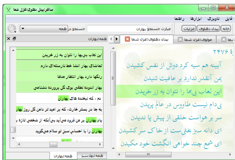
شکل ۳.۲: برجسته‌سازی کل خط برای عباراتی که بطور کامل متفاوتند